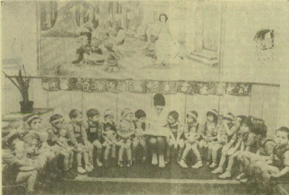
Mintegy 300 000 gyerek jut el napról napra az óvodákba, a játék és a szórakozás mesevilágába — de sajnos, több mint 100 000 még kívülreled,