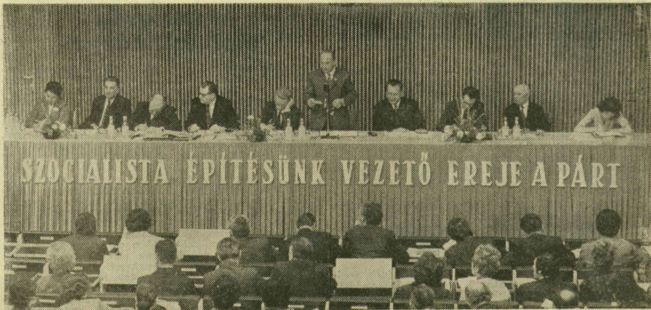
A városi pártértekezlet elnöksége