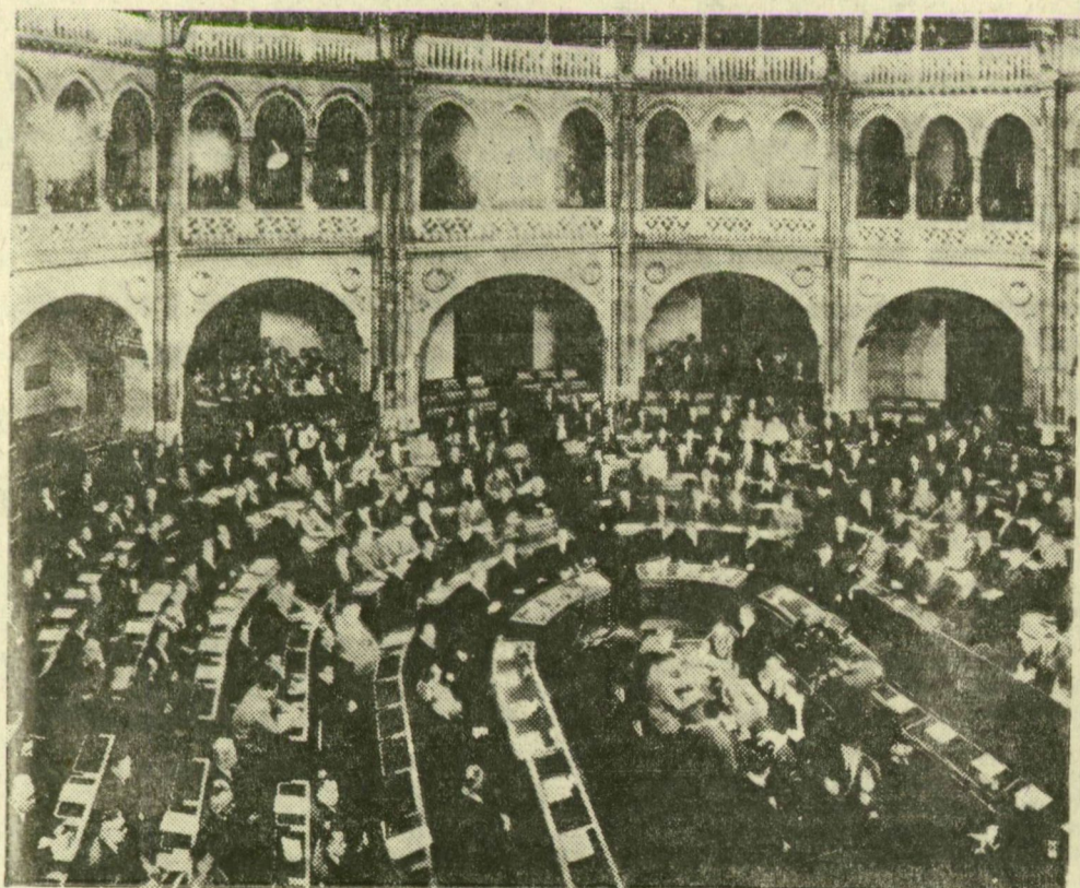
Az országgyűlés, amely a függetlenségi front első győzelme után már valóban a munkáshatalom kifejezője volt, törvényerőre emelte a népköztársaság alkotmányát.