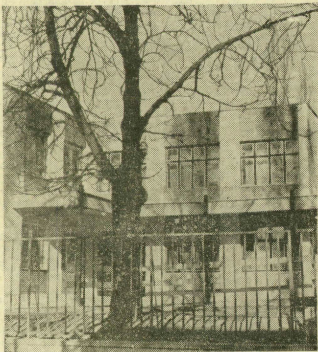
Épületszárny a Tolbuhin sugárúton

Egy hete avatta föl az egészségügyi miniszter helyettese a szegedi városi tanács kórházának új épületszárnyában berendezett ideg-elmegyógyászati osztályt. A Tolbuhin sugárút kétszintes, szimmetrikusan kiképzett épületében 32 kórtermet és négy betegfoglalkoztató szobát helyeztek el, s mint korábban beszámoltunk róla, átmenetileg itt lesz a kijózanító állomás is. A 150 ágyas osztály közel 15 millió forint költséggel készült, további bő másfél millióból biztosítják folyamatos felszerelését. A múlt heti avatónnepeket követően, mától csütörtöktől fogadja betegeit.