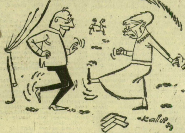
— És gondolja Lajoska, megcíméni a maga nyugdíj...?