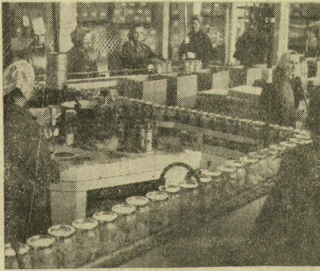
Csomagolják az első exportszállítmányt, műszakonként 40 ezer üveg őszibarackbefőttet zárnak dobozba a konzervgyárban

nyagon vár a hazai vegyipar, hiszen izopentánt eddig csak külföldről szerezhettek be.