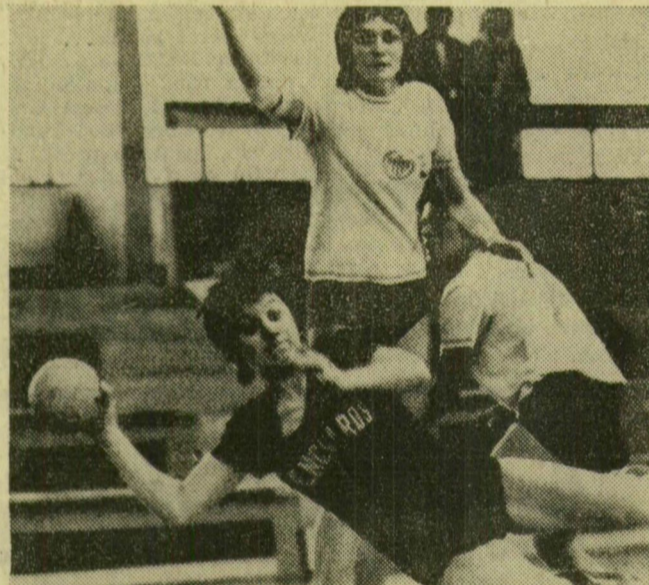
Tökéncé az egyik ferencvárosi támadást látványos lövéssel fejezi be