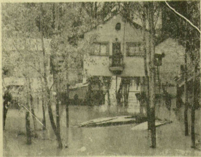
A Sárgán az alacsonyan épített üdülőházak ablakáig ér a víz.

Rendkívül szeszélyes volt az idén a természet, amely a sok évi átlagtól eltérő esőzésekkel néhány hónap alatt egymást követően háromszor duzzasztotta meg rendkívüli mértékben a Tiszát és mellékfolyóit. A folyó vízállása Szegednél még most is áradó, közelít a tetőzészhez, amely várhatóan e hét végén következik be, 750—800 centiméter közötti vízmagassággal.