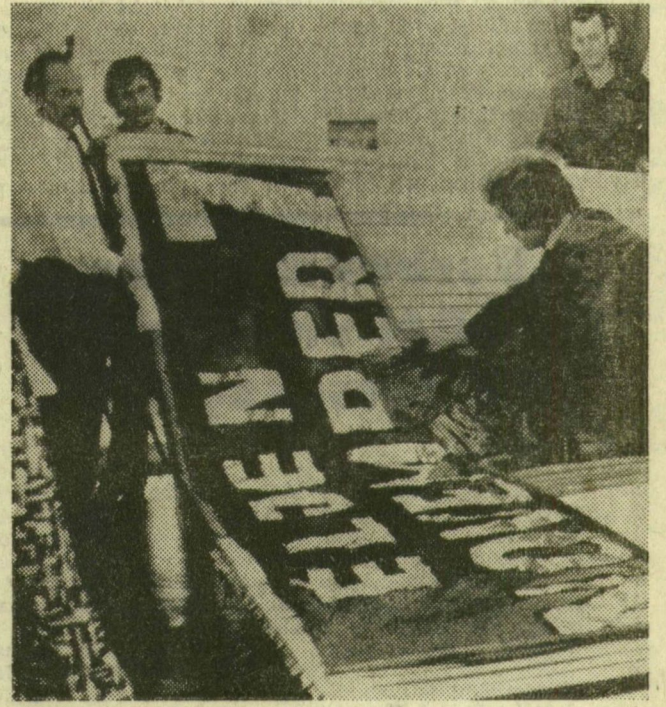
November 7. tiszteletére ünnepi díszbe öltözik a város. Szeged üzemei, intézményei dekorációkkal ékesülnek. A ruha- gyár bejárata fölé kerül a felvételen látható és készülő transzparens. November 7. tiszteletére tegnap megkezdődtek az ünnepségek. Erről összeállításunk a 3. oldalon.