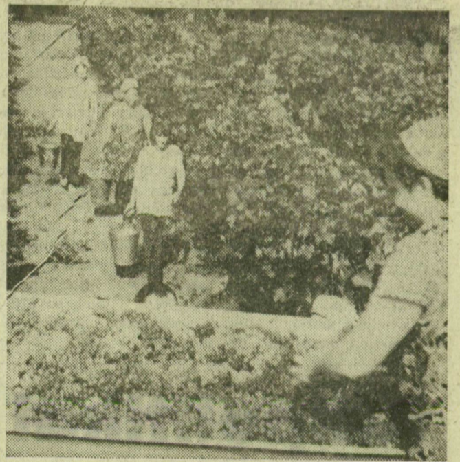
Szüretelnek Kistelek határában