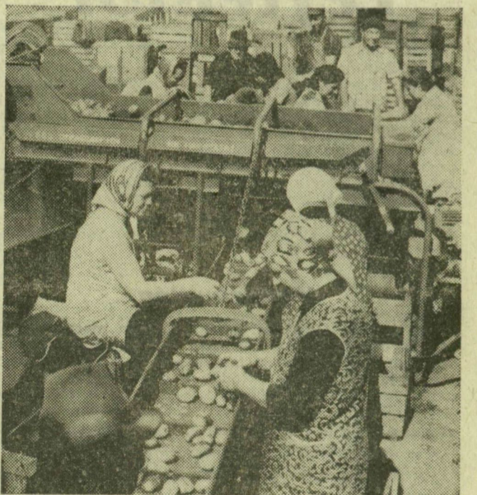
Géppel válogatják a krumplót a forráskúti szövetkezetben Sz. J.