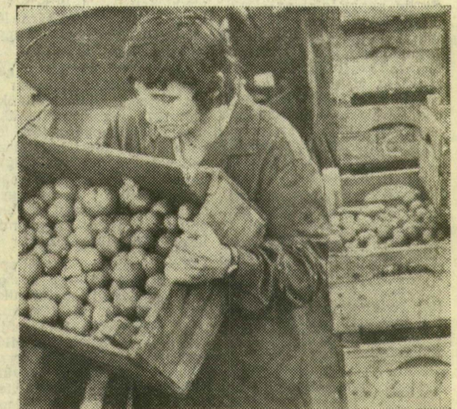
Megérkeztek az első szállítványok paradicsomból

Az igazi konzervgyári szezon vidékünkön a paradicsom és a paprika feldolgozása jelenti. A bolti árak csökkenése jelzi, hogy hamarosan megkezdhetik ezt a munkát is. Az első szállítványok megérkeztek, né-