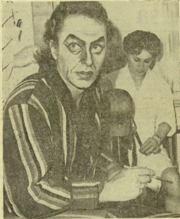
A maszkirozás percei

— Már gyermekkoromban nagyon szerettem táncolni. Könnyedén sajátítottam el az orosz tánc legnehezebb fogásait is. Persze, csak kedvtelésből, a magam öröme táncoltam, eleinte nem is gondoltam arra, hogy ezt valaszam hivatásomnak. Így, csak tizenhat éves koromban — szüleim és rokonaim biztatására — jelentkeztem a leningrádi balettintézetbe. Tanulmányaim végzetével, legelső szerepem a Don Quijote Espadójá volt. Eleinte a klasszikus balett