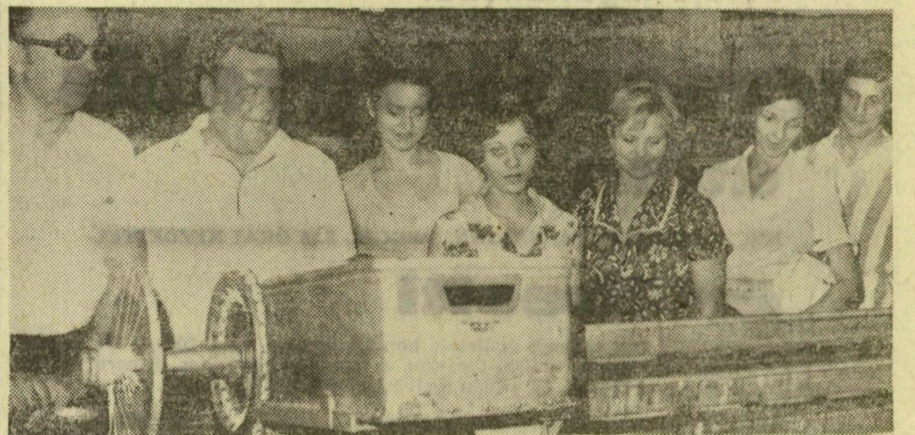
Az újszegedi gyár szövőüzemében

A felsorolt 10 vállalat mellett a karneválon való eredményes szereplés jutalmul még jó néhány üzem és vállalat fiataljai részesülnek dícséretben, értékes tárgyjutalomban. Többek között Szeged-Tápé valamennyi KISZ-szervezete, az Ecset- és Seprűgyár, valamint a gumigyár fiataljai. A díjakat és jutalmakat a KISZ Szeged városi bizottságának nevében a szeptemberi titkári értekezleten adják át a nyerteseknek,