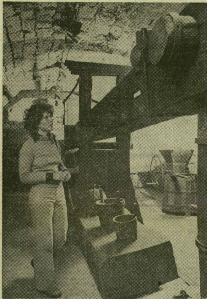
A nemrég megnyílt hangulatos tokaji múzeumban a tokaji borpincék jellegzetes berendezéseit, régi borászati eszközöket láthatják az érdeklődők. Képünkön: A kőnehezékes bálványprés, 1848-ból.