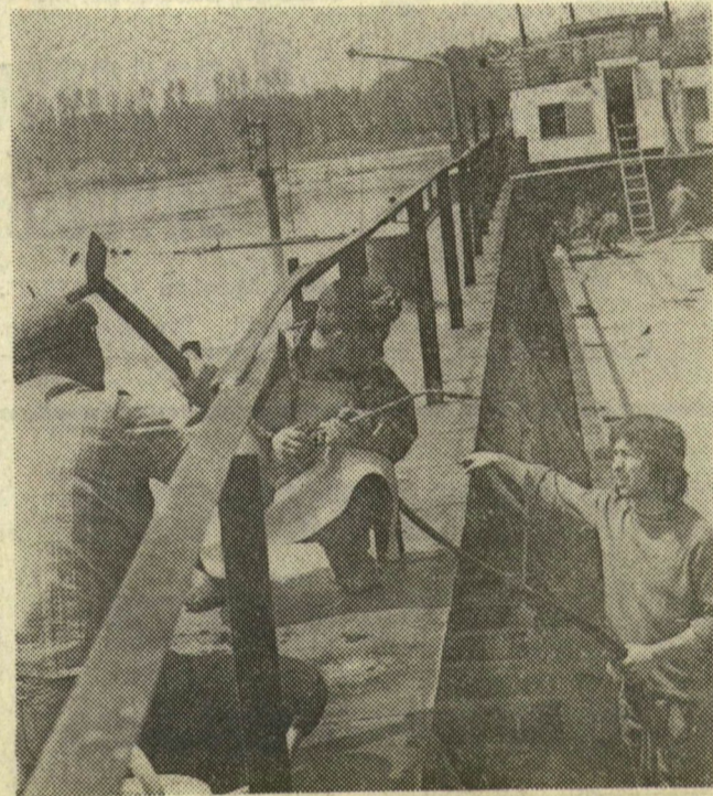
A magas őszi ár hullám a tápéi hajójavító műhelycsarnokait „nyaldossa”, de a termelőmunkát ez sem zavarhatja. Meghosszabbították a lépcsőfeljárókat, amelyek a készülő uszályokhoz vezetnek és a hegesztők a víz felett végzik munkájukat

A hajójavító kilenc szocialista brigádja élen jár a kongresszusi munkaversenyben, a vállalások maradéktalan teljesítésében. Többek között máris sikert könyvelhetnek el, hiszen, amint azt vállalták, hogy egy kavics szállító uszályt tíz nappal a határidő előtt elkészítenek, be is váltották ígéretüket, készen van az uszály, néhány nappal ezelőtt megtörtént az átadás. Különben ebben az esztendőben hat darab 1500 tonnás, s jó