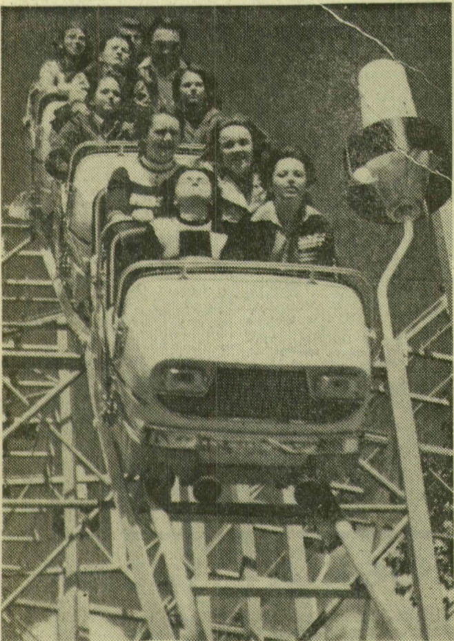
A fővárosi Vidám Parkban birtokba vette a nagyközönség az Olaszországból vásárolt „Ciklon”-hullámvasutat. Az automatizált játékon sokan szórakoznak.