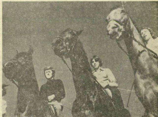
Lovagolnak a főiskolások