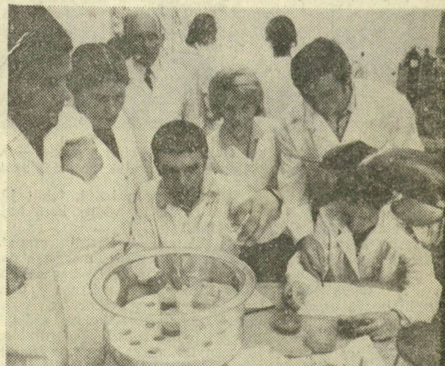
A takarmányozási tanszék laboratóriumában a különféle takarmányok fehérjetartalmát határozzák meg a hallgatók

Hódmezővásárhelyen 1896 óta képeznek agrárszakembereket. A Mezőgazdasági és Élelmiszerügyi Minisztérium — pár éve — főiskolai rangra emelte a korábban technikusként működő intézményt, ahol az Élelmiszeripari Főiskola Állattenyésztési Kara működik. A hallgatók 3 évi tanulmányi idő után általános mezőgazdasági ismeretekkel rendelkező állattenyésztési, takarmánygazdálkodási, illetve vadgazdálkodási üzemelnöki képesítést kapnak.