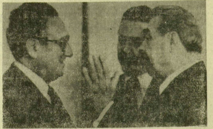
A Kremlben megkezdődtek Brezsnyev és Kissinger tárgyalásai. Képünkön: Brezsnyev és Kissinger tanácskozik

— Az Egyesült Államok továbbra is törekszik a szovjet-amerikai kapcsolatok javítására, amelynek az alapját Leonid Brezsnyev és Richard Nixon tárgyalásai idején vetették meg. Tovább keressük az előrehaladás lehetőségeit, mivel a nemzetközi béke jelentős mértékben az Egyesült Államok és a Szovjetunió közötti békés és jó kapcsolatoktól függ. Remélem, hogy a moszkvai tárgyalásokon bi-