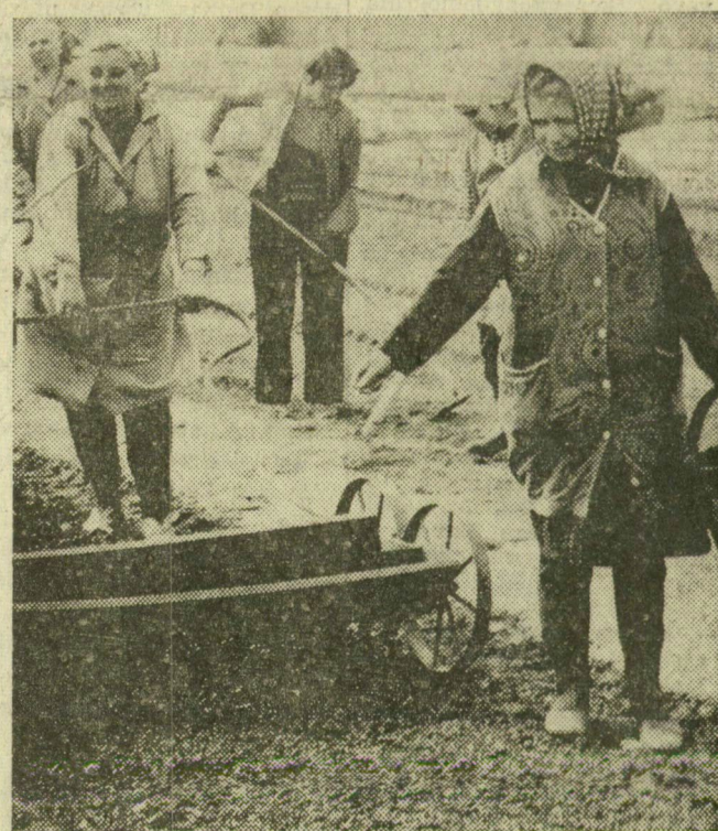
Paradicsompaprikát, ceceli és fűszerpaprikát vetnek a szegedi Móra Tsz kertjében