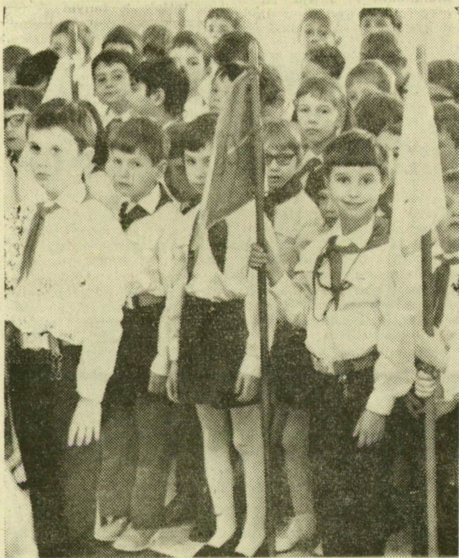
Ülörök az új iskola ünnepségén

A nagygyűlés az Internacionálé hangjaival ért véget.