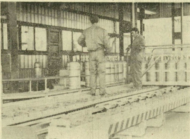
A nehéz palackokat itt már futószalag továbbítja