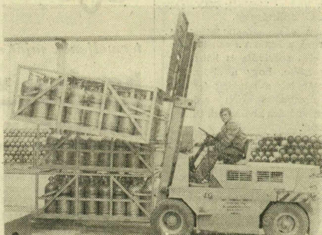
A rakodási- és a szállítást konténerek gyorsítják és könnyítik