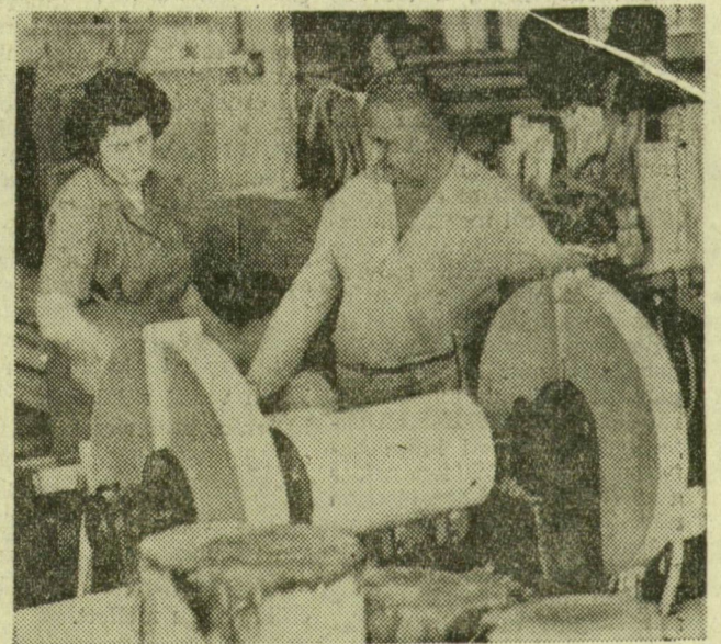
A farönköket nyolevan centiméteres darabokra vágják, majd szabályszerűen vékonyra esztergályozzák, a lapok vastagsága megfelel a gyufaszálak méretének

Hazánk egyik legrégebbi gyára a szegedi gyufagyár, rajta kívül csak Budafokon készítenek még gyufát. Tavaly a szegedi üzemben 350 millió dobozzal gyártottak, egy-egy munkanap alatt egy és egy-negyed millió gyufásdoboz hagyja el a gyárat. Képeinken a gyufagyártás néhány mozzanatát mutatjuk be.