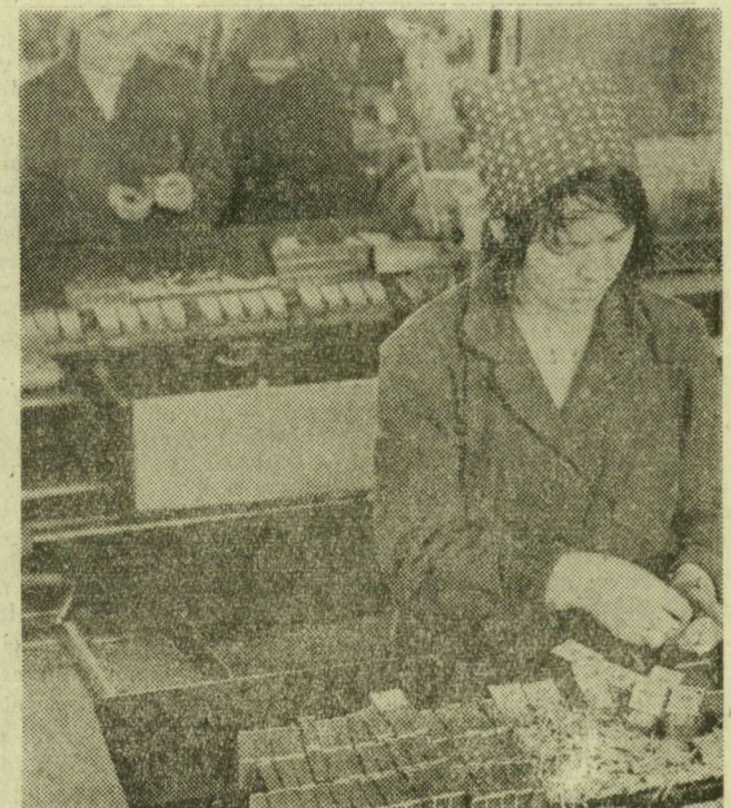
Az ügysz töltőgépek dobozokba rakják a szálakat, egy-egy dobozokba ötvenet