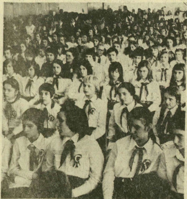
A megnyitó ünnepség résztvevőinek egy csoportja