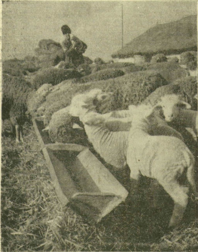
A nádudvari Vörös Csillag Tsz-ben évente 10 millió forint jövedelmet biztosít a juhászat. Az idén tavasszal több mint 4 ezer pecsenyebárányt értékesítenek. Legtöbbször Olaszországba szállítanak. Képviselet: etetés.