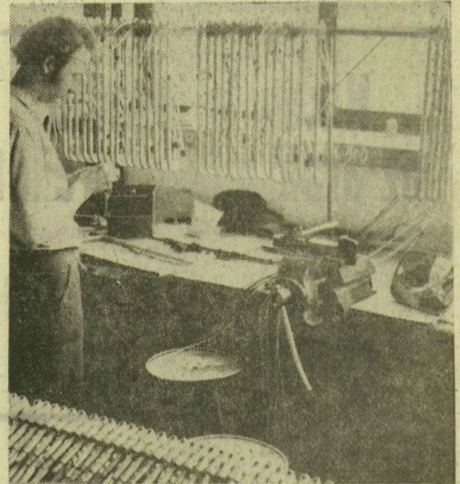
Szerelik a visszapiillató tükröket. Ezekből a Szovjetunióba is szállítanak, amelyek akkumulátorral fűthetők.

A Szegedi Fémipari Vállalat több, mint tíz éve készít szerelvényeket a Ikarus gyárnak, de ezek mellett jelentős az a termékmennyiség is, amelyet az élelmiszer, valamint a nyomdaipar megrendelésére gyártanak. Kevesen tudják, hogy a szegedi panoráma-buszok visszapiillató tükröit, tejszellőzőit, járatjelző tábláit, valamint napellenzőit is Szegeden készítik. Képeink a vállalat munkájáról adnak mozaikot.