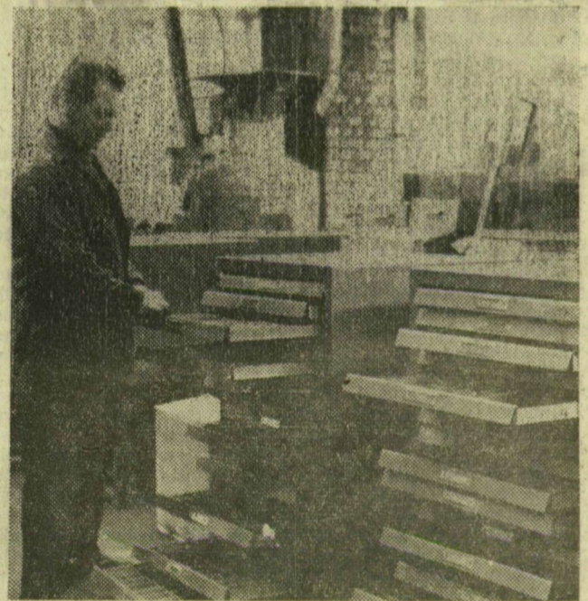
Szállításra készek a nyomdai betűszedőszekrények