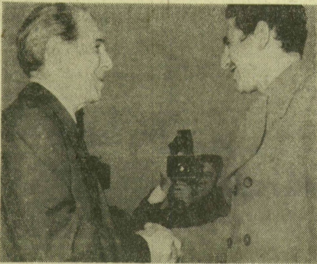
Abduszalem Dzsallud, a Líbiai Arab Köztársaság miniszterelnöke hazánkba érkezett. A líbiai vendéget Fock Jenő, a Minisztertanács elnöke fogadta a repülőtéren