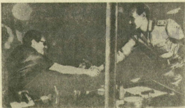
Mohammed Gamazi egyiptomi és Aharon Jariv izraeli tábornok a hadifogolycsere szabályozó megállapodás aláírása után

Háromnapos huzavona és újabb feszültség után csütörtökön végre megkezdődött a közel-keleti tűzszünet megerősítő egyiptomi-izraeli megállapodás végrehajtása. A nemzetközi Vöröskereszt bérelt repülőgépekkel összesen 250 sebesült egyiptomi és 26 sebesült izraeli hadifogoly térhetett vissza hazájába. Ezzel egyidejűleg — mint az ENSZ szóvivője Kairóban bejelentette — az izraeli csapatok átadták a Kairót Suezzel összekötő országút két ellenőrző pontjának felügyeletét az ENSZ békefenntartó hadierőinek. Rövidesen áthaladt az első segítségállomány, amely Suez városába vitt élelmiszert, gyógyszert, vizet és más fontos utánpótlást. A nap folyamán újabb konvojok is végighaladtak az úton, az izraeliek azonban továbbra is csak az ENSZ felségjelével ellátott gépkocsikat és az ENSZ alkalmazottait bocsátják be Suez városába.