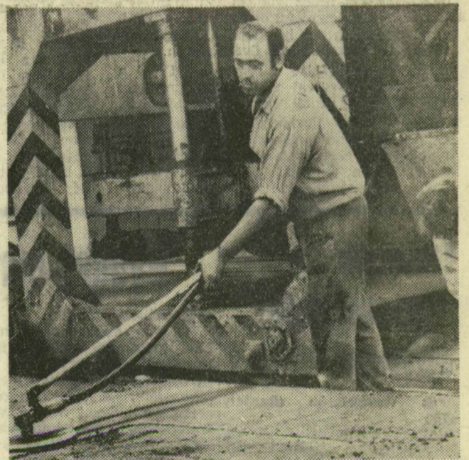
A sablonokba, a vasvázás szerkezetre, nyersbetont tömörítnek, ügyes kis simítógép végzi el a felületi munkát.