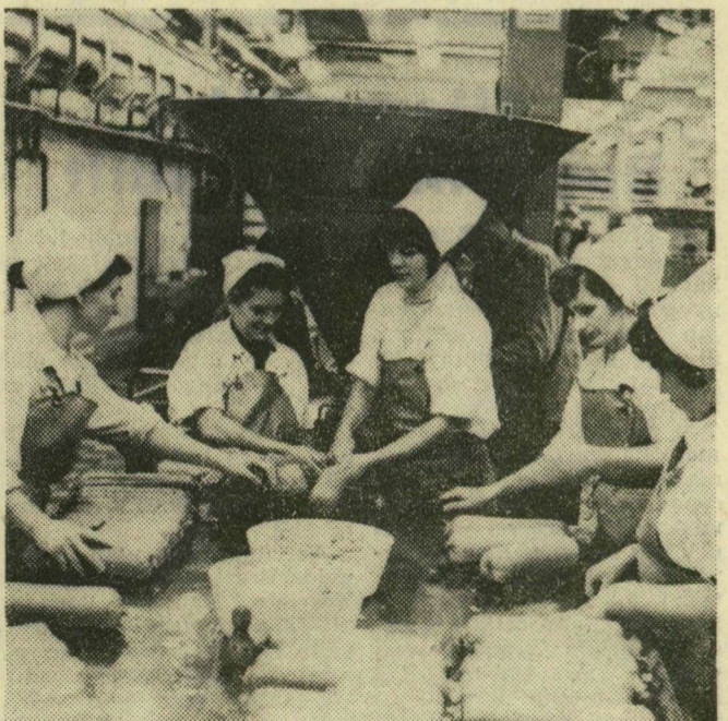
Az utolsó mozzanatok, amit viszont a gép nem oldhat meg: a betöltött parizert lezárják és csomagolják.