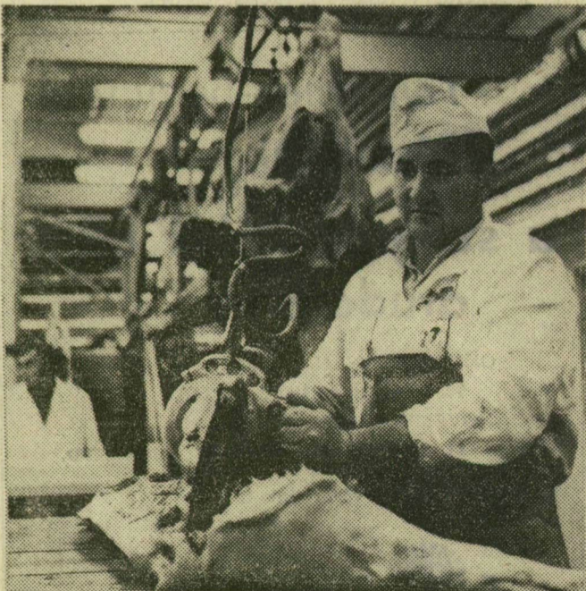
Bárd, nagykés helyett villámsebessé mozgó elektromos fűrészsel darabolják a sertést.

Országsszerte befejezés előtt áll a szüret, a termés 95 százalékát szedték le eddig a gazdaságok és az egyéni, háztáji termelők — tájékoztattak a borgazdasági vállalatok trüszjtjénél. A pincegazdaságokkal szerződéses kapcsolatban levő termelők eddig az elmúlt év azonos időszakához képest 50 százalékkal több szőlőt és mustot ajánlottak felvásárlásra. Ez is azt jelzi, hogy az idei szüret jól sikerült. A termelők a minőséggel is elégedettek; az országos adatok szerint a must cukortartalma 1,5—2 fokkal nagyobb a tavaly mérténel. A pincegazdaságok borászai örvedetesnek tartják, hogy a feldolgozásra beérkezett szőlő igen egészséges volt, légtartalma megfelelően alakult, a zamatanyagok is jól feldúsultak a szőlőszemekben.