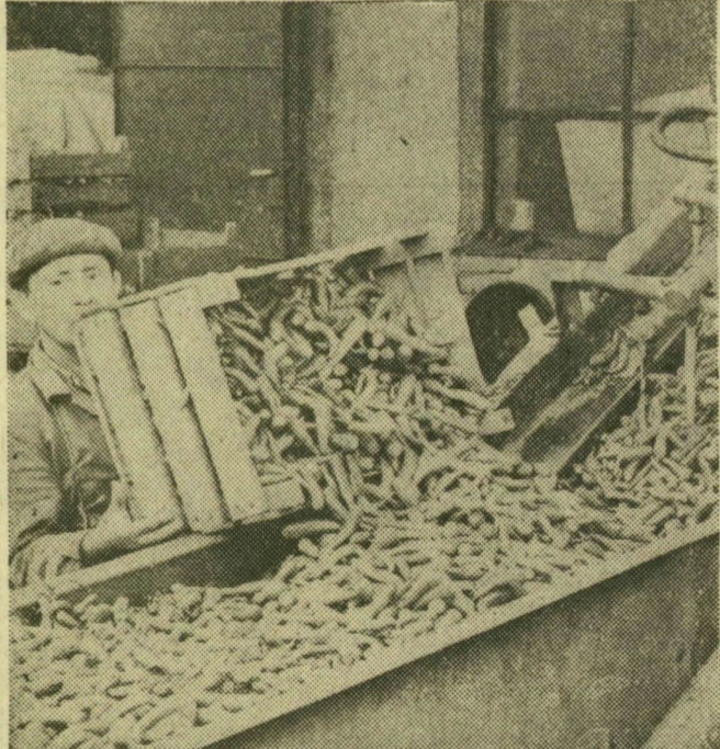
Mossák, majd szelctelik a piros terményt. Így készítik elő a szárításra

Szeptember elején érkeztek az első ideai paprikaszállítmányok a Szegedi Paprikafeldolgozó Vállalathoz. Ettől kezdve az új termést mossák, szelctelik, szárítják és őrlik a vállalatnál. Felvételeinken az izletes paprikaőrlemény készítésének néhány mozzanatát örökítettük meg.