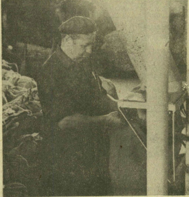
Zsákokba csomagolják az őrölt paprikát