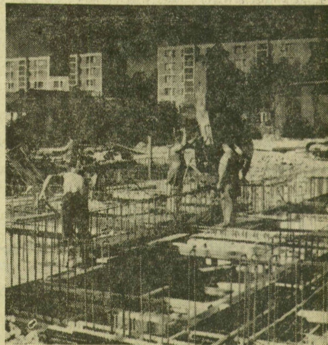
A daru újabb betonadagot szállít az alapozáshoz. Hátterben az odesszai városrész Tisza-parti „rég” épületei

A nyárral vetekedő őszi kintő feltételeket teremt az építkezéseknek. Szeged Odessza városrészében — a volt ládagyár területén — a DELEP igyekszik is kihasználni ezt. Képeink a szegedi lakásépítkezési program egyik új színhelyét mutatják be.