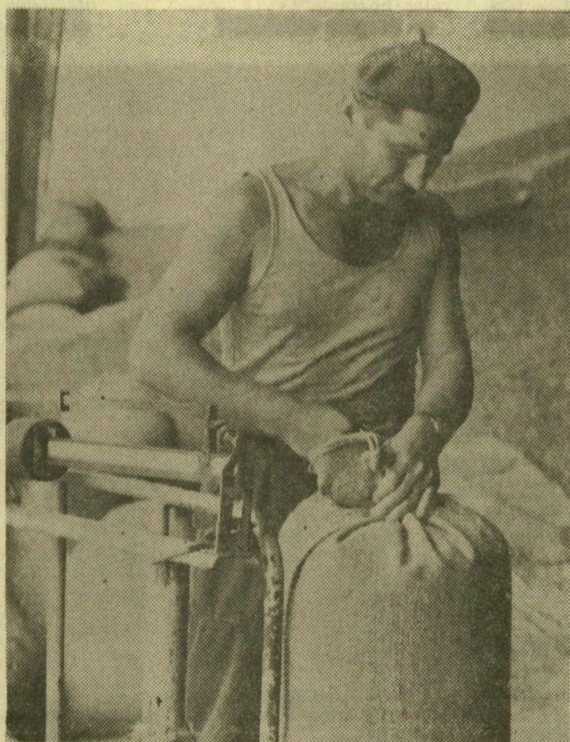
Telnek a zsákok a Felszabadulásba