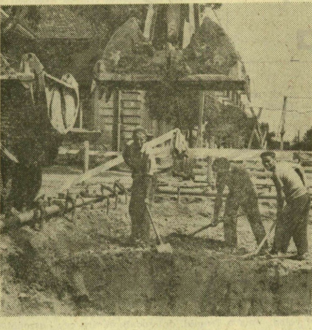
A kórház sarkán a főcsatornának készül a hely, átvágják a sugárutát