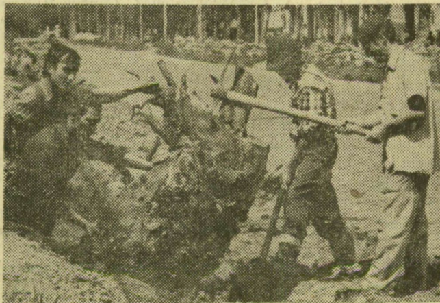
Az építkezés első tennivalója: a tuskók kiemelése sem könnyű feladat