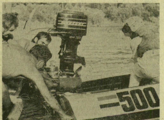
Elindult az ötszázas, Utolsó pillantás a segítők felé