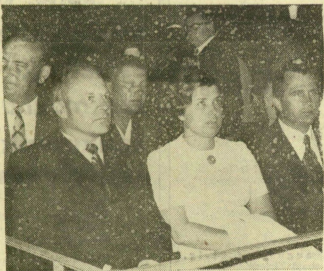
Az odesszai küldöttség tagjai a szabadtéri nézőterén

Este megtekintették a Szegedi Szabadtéri Játékok János vitéz előadását.