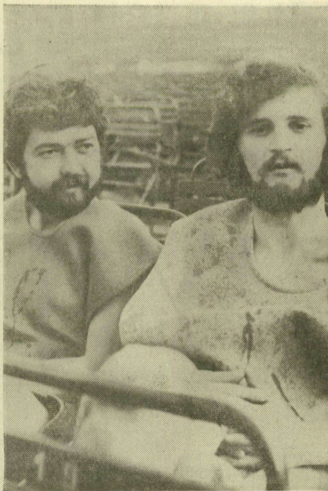
Statisztaarcok a Mózesből