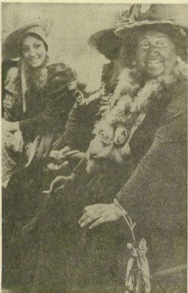
A kórus az öltöző folyosóján

A legnagyobb angol cigarettagyár rövidesen egészségre ártalmatlan cigarettát fog gyártani. Facellulózsból állít elő „dohányt”, amely nem tartalmaz nikotint, s kátránytartalma is a valódi dohányynak csak 20 százaléka. Skóciában gyárt építenek, amelyben az új dohányanagból évente 10 000 tonnát állítanak elő. Ez a mennyiség az angolok évi dohányszükségletének egy tizede.