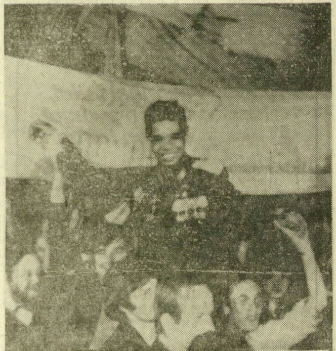
Osztatlan szeretet kísérte vasárnap a VDK küldötteit a VIT-en abból az alkalomból, hogy indokainai szolidaritási napot rendeztek