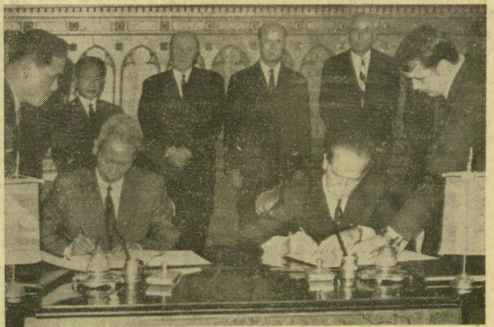
A magyar—vietnami tárgyalások okmányainak aláírása