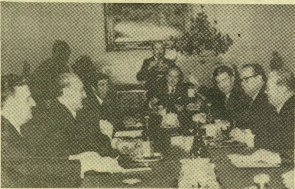
Kádár János és Joszip Broz Tito munkatársaikkal a tárgyalóasztal mellett

Szerdán délelőtt a Brioni szigetsoporthoz tartozó Vang szigeten folytatódott Kádár Jánosnak, az MSZMP KB első titkáranak és Joszip Broz Tito államfőnek, a JKSZ elnökének megbeszélései, amelyeken a két ország és párt kapcsolatairól, valamint a nemzetközi helyzet és a nemzetközi kommunista és munkásmozgalom időszerű kérdéseiről volt szó. A szerdai tanácskozás végzetével a jugoszláv államfő és pártelnök ebédelt látogató vendégül Kádár Jánost és feleségét. Az ebéd befejezése után a vendégek megtekintették Vanga szigetét.