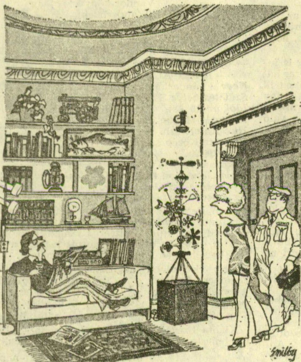
— Megjötték a galériától a szobrok otájozására.