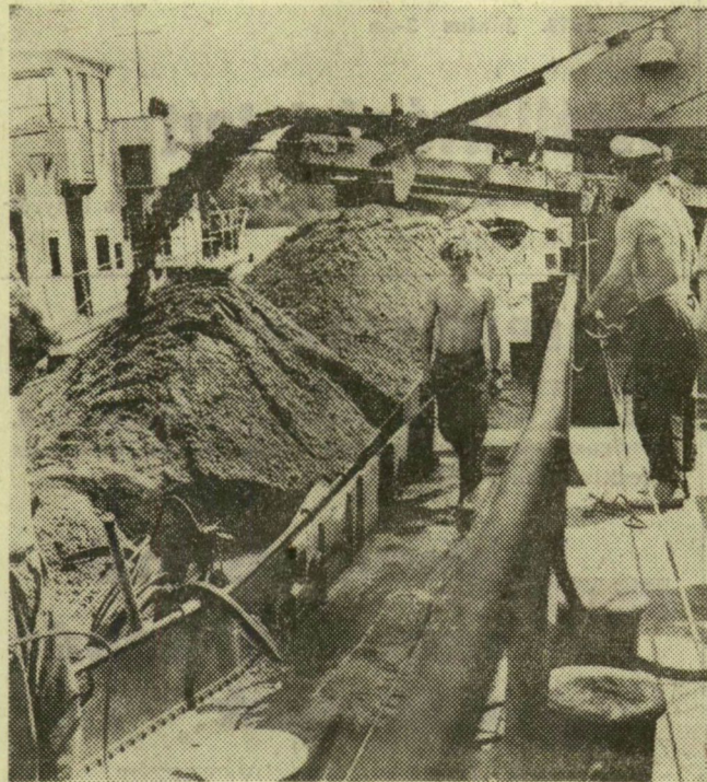
Az uszály megtelt, a kotrómester int, hogy mehet a rakodótér előtt az elevátor kanálai alá állítják az uszályt