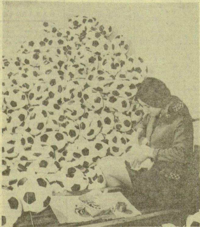
Simontornyán 1963 óta gyártanak futball-labdát. A Börös Szörmefeldolgozó Vállalat tíz év alatt másfél millió labdát készített, amelynek 90 százalékát exportálták