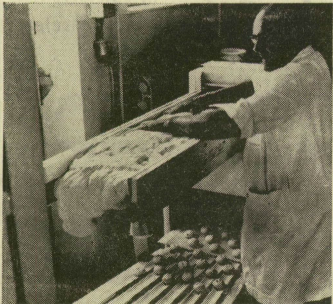
Az automatikus osztórészről 6 szalagon azonos súlyú tészadarabok jönnek ki

Huszonhét méteres „utazás” után futószalagra csúsznak a kész péksütemények