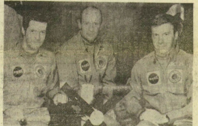
A három amerikai űrhajós, aki a Skylab űrlaboratórium lakója kíván lenni. Balról jobbra: Joseph F. Kerwin (kutatópilóta), Charles Conrad jr. (parancsnok) és Paul J. Weitz (űrpilóta)

A 10 nap óta tartó Föld körüli pályán keringő amerikai Skylab űrlaboratórium három leendő lakója pénteken reggel 9 órakor — közép-európai idő szerint 14 órakor — hibátlan indítással felemelkedett Apolló típusú űrhajóján a Cape Kennedy rakétatelepről, hogy kísérletet tegyen az indításnál megrongálódott űrlaboratórium levált hőszigetelő burkolatrézének pótlására, illetve két elromlott elektromos energia-termelő telephoz működésbe hozására.