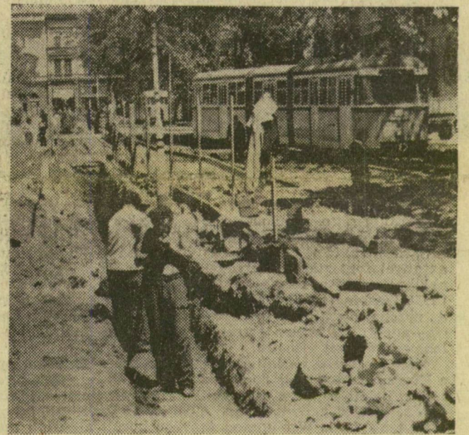
Felbolydult a tér megszokott rendje, villamosvágányok szűnnek meg, újak épülnek, s helyükön állnak már a forgalomirányító lámpák tartóoszlopai is