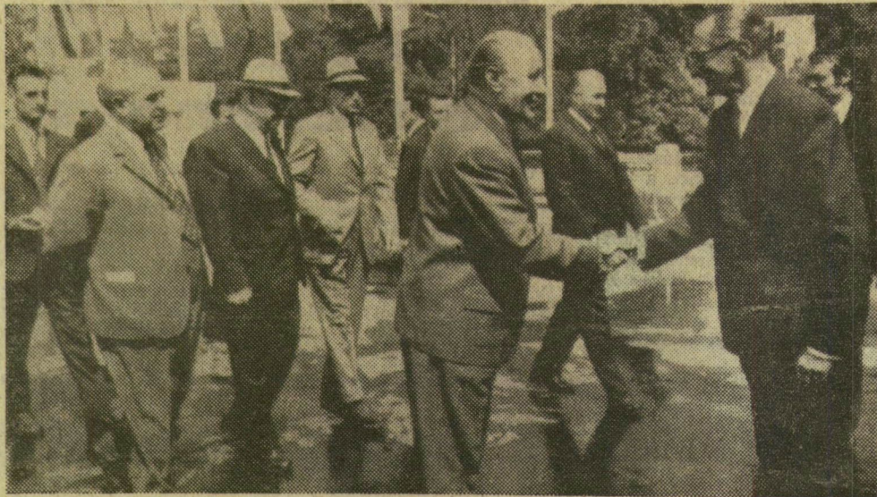
Kádár Jánost üdvözi Erdély-Gröz Tibor, az Akadémia főtitkára, az MTA pavilonja előtt

Hétfőn magas rangú párt- és állami vezetők látogattak a BNV-re. A vásárt főke-reste Kádár János, az MSZMP Központi Bizottságának első titkára, Losonczy Pál, a Népköztársaság Elnöki Tanácsának elnöke; Aczél György, az MSZMP Központi Bizottságának titkára, Ap- ró Antal, az országgyűlés el-