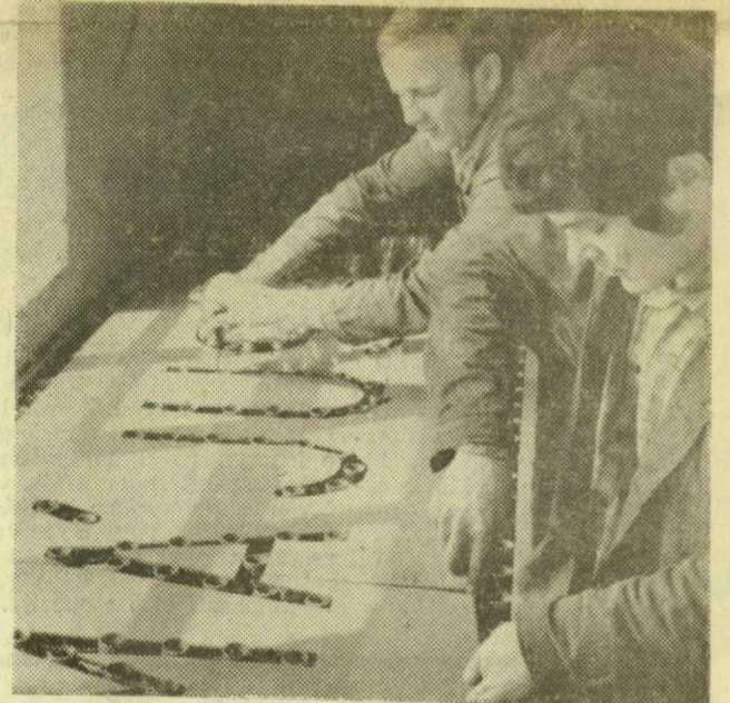
Egy betű — tucatnyi villanykörte. Villanyszerelők dolgoznak a juthatóság transzparensein