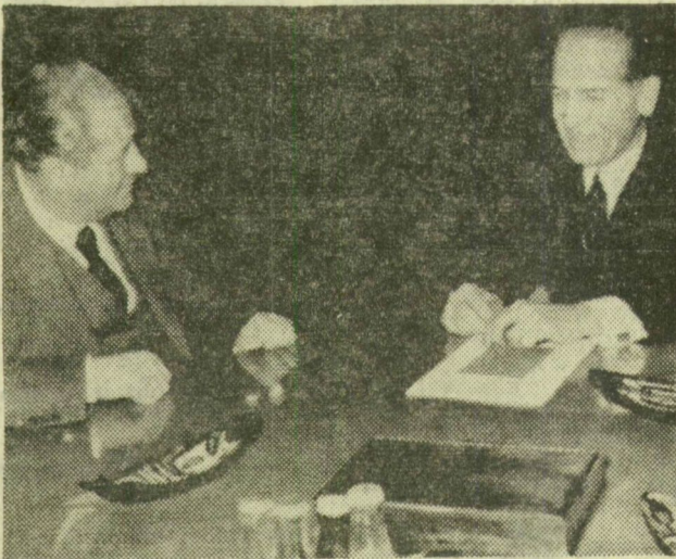
Fock Jenő, a Minisztertanács elnöke fogadta dr. Bruno Kreiskyt, az Osztrák Köztársaság kancellárját