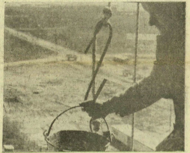
A technológiai berendezések szerelésén, alapozásán dolgoznak minden szinten. Nagy magasságra kötélben húzzák fel a szükséges építőanyagot