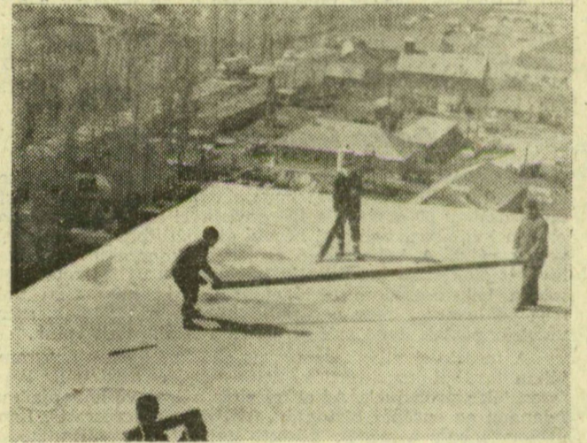
Utolsó simítások az épület tetején, amely mögött a gyárak is eltörpülnek.