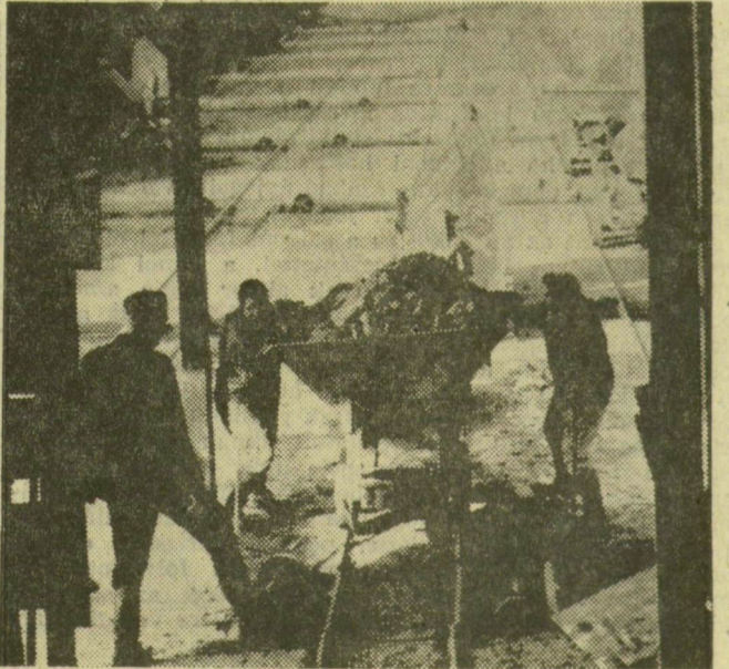
Újra indulnak a esillék, hogy az agyagot a keverőműbe szállítsák

A hideg nélküli tél, a kedvező időjárás hatására az idén jóval előbb látnak munkához a téglagyárak. Képeink a szőregi üzem „újraéledését” mutatják be, ahol hamarosan megkezdődik a téglakészítés.