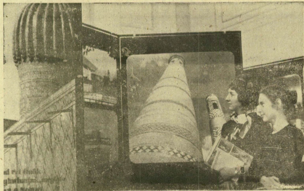
Részlet a kiállításról

— Jobb terveket készítenek majd. Már csak azért is, mert minden közvetlen felletnes a legfőbb érdeke, hogy reális végrehajtható, de nem alátervezett feladatokat szabjon a beosztottainak. Ha nem ezt teszi, könnyen rajta csattan az ostor: neki kell lehetetlen munkát megcsinálni. Na, de ilyenre azt hiszem, nem kerül sor. A másik: sokkal jobban együtt kell működni minden embernek. Például nekem a termelési osztályvezetővel, hogy a lehetőség szerint teljesítse a feladatát. O azért, hogy a gyárüzem vezetői „ne bukjanak” meg és így tovább. Mert primum, jutalom, illetve a beosztás előnye csak akkor illetik meg a szóbanforgó vezetőt, ha minden szinten megmarad az eredeti állapot. Talán ez bonyolultnak halatszik, a valóságban azonban ez nagyon egyszerű: nekem nagyon rajta kell tartanom a szememet a termelési osztályon, nehogy a nyakamba szakadjon az egész gyár legapróbb termelési gondja is! En nagyon örülök, hogy januártól megpróbálkoztunk ezzel, mert több időm marad igazi főmérnöki munkával foglalkozni. Persze nem szabad elfelejteni, hogy az új módszer lényegében nem teljesen új — hisz három év óta alapozzuk. Ennek érdekében állítottuk fel a diszpécserközpont automata berendezésekkel, bevezettük a részleges munkaversenyt. Csak ezekkel együtt van lehetőség arra, hogy a jóval