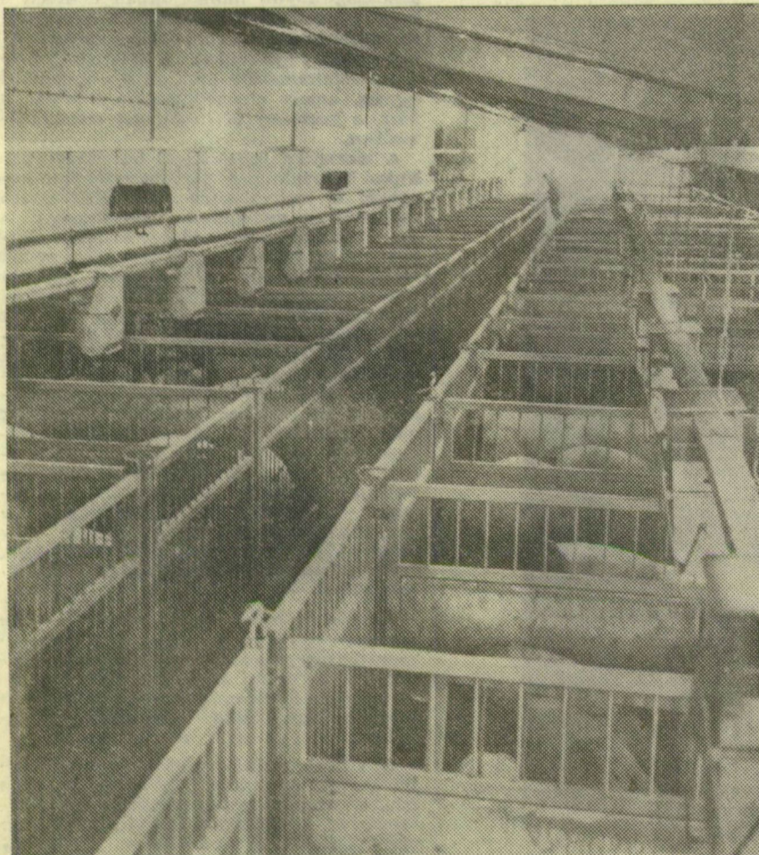
A GORZSAI ÁLLAMI GAZDASÁG „COTTSWOLD” HIBRIDERTÉSTELEPE